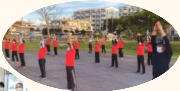
【助成団体】 アップル公園ラジオ体操会 ♪正しいラジオ体操で健康づくり♪