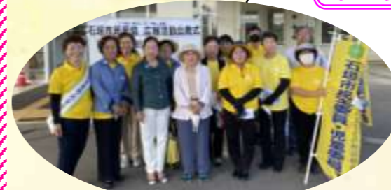
【助成団体】 石垣市民生委員・児童委員協議会 活動助成