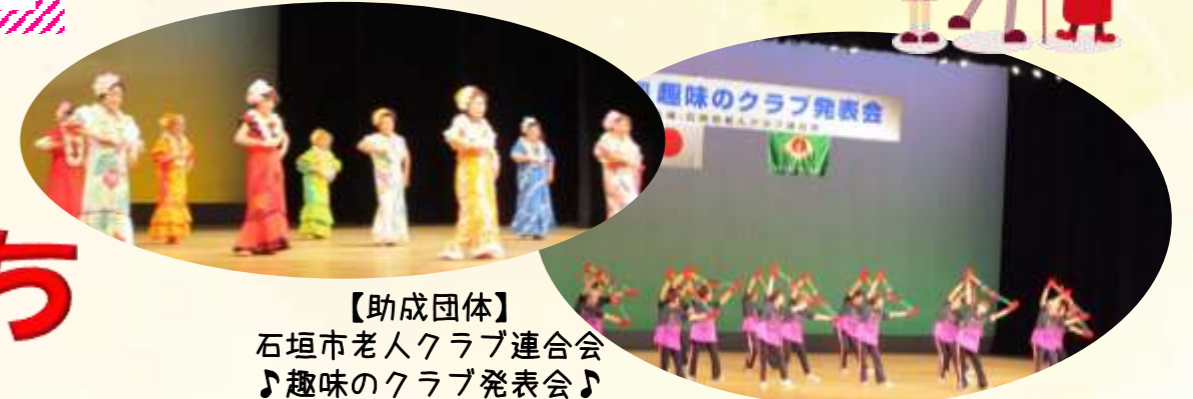
【助成団体】 石垣市老人クラブ連合会 ♪趣味のクラブ発表会♪