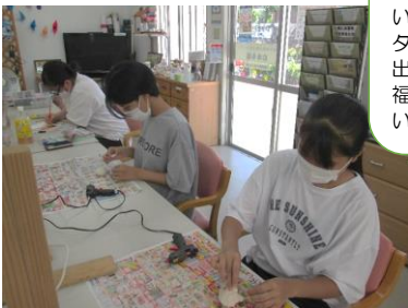
貝細工に挑戦！！ お二人とも集中しています😊