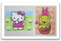
キティちゃん・フーさん