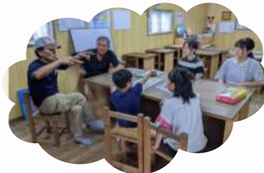
【助成団体:(一社)龍心】 ♪子どもの居場所 ていだぬふあ教室♪