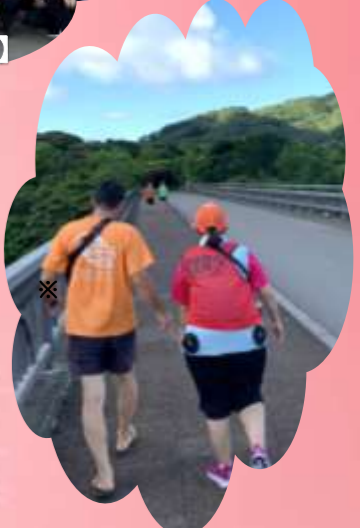
【助成団体:伴ネット 八重山支部】 ※沖縄伴走ランナーネットワーク ♪視覚障がい者伴走講習会・マラニック♪