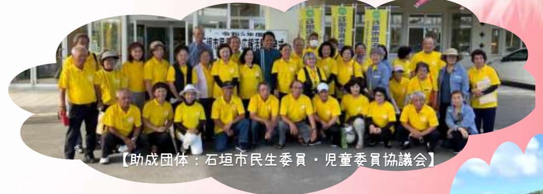
【助成団体:石垣市民生委員・児童委員協議会】