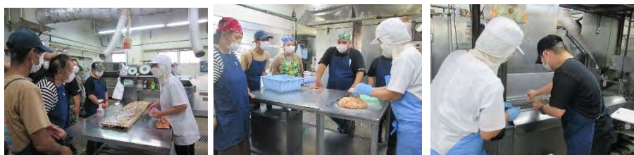
見学させていただき、ありがとうございました☆彡

8月15日(火)、八重山かまぼこ専門店「かみや一き小 かまぼこ店」に見学に行ってきました。かまぼこを作る工程にみなさん興味深々♪真剣に話を聞き、質問も飛び交いました。たらし揚げを作る体験では、すり身を好きな大きさにちぎって油の中へ投入。できたて熱々のかまぼこに「美味し〜！」と感動の声が上がりました。