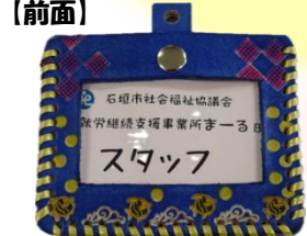
【オーダー例】石垣の海