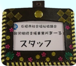
【オーダー例】「お花畑」