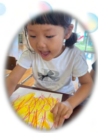
おえかきじょうずでしょ