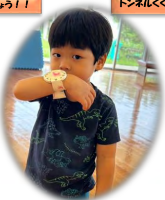
みてみて~かっこいいでしょ♡