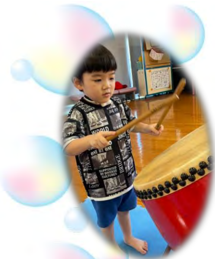
たいこめいじんとうじょう!!