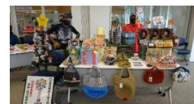
↑「まーる」看板が目印